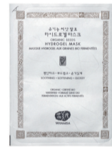
WHAMISA BIO MASKA VYPÍNAČÍ A ZPEVŇUJÍCÍ