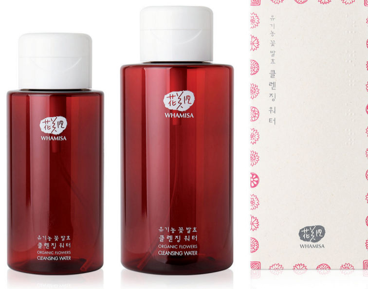
WHAMISA BIO ODLIČOVACÍ VODA 300ML, 500ML

pleti: FLOWERS, FRUITS a SEEDS. Kromě výše zmíněného se rozhodl rozšířit portfolio o nové produkty dle typu pleti. Např. pleťové lotiony nebo anti-aging pleťové oleje budou pro suchý, smíšený nebo mastný typ pleti. Vybere si opravdu každý. Jaro budíž pochváleno! AMEN.