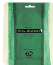
WHAMISA BIO ANTI-AGE LIFTINGOVÁ MASKA KELP