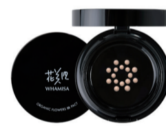
WHAMISA BIO BB KRÉM SPF50+/PĚT ODSTÍNŮ