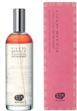
WHAMISA BIO HYDRATAČNÍ SPREJ DEEP RICH – JIŽ BRZY V PRODEJI

A co víc? Výsledky vidíte v podstatě okamžitě. Adenosin totiž příznivě působí na unavenou pleť.