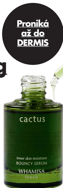
WHAMISA FRESH přírodní liftingové sérum z opuncie

Pro kosmetický průmysl se z opuncie získává extrakt, a to buď z různých částí rostliny samostatně, nebo i z rostliny celé. Může se také lisovat přímo jen olej ze semen. Ten je ale