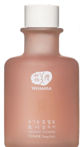
TONIKUM DEEP RICH