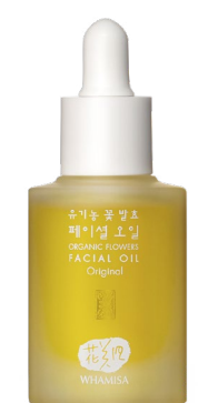
ANTI-AGE PLEŤOVÝ OLEJ ORIGINAL

Čajovník čínský podporuje obnovu kožních buněk a kolagenu. Zabraňuje ztrátě elasticity a tvorbě vrásek. Kromě jiného efektivně funguje i na již vzniklé vrásky.