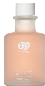
BIO TONIKUM DEEP RICH

Obsahují GLUKONOLAKTON, který významně přispívá k redukcii pigmentových skvrn.