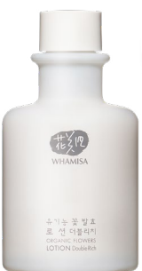
LOTION DOUBLE RICH