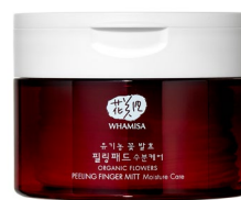
BIO PEELING HLOUBKOVÉ ČISTIČÍ