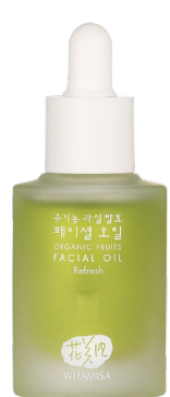
ANTI-AGE PLEŤOVÝ OLEJ REFRESH