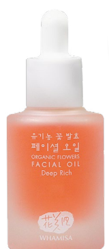
ANTI-AGE PLEŤOVÝ OLEJ DEEP RICH