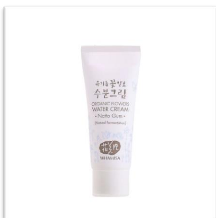
Intenzivně hydratační krém WHAMISA (5 ml, 170 Kč) s obsahem rostlinného kolagenu dodá pleti pružnost a svěží vzhled.