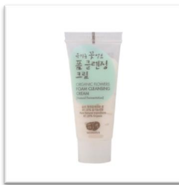
Pěnový čistící krém WHAMISA (20 ml, 180 Kč) Čistí pleť a účinně uvolňuje póry.