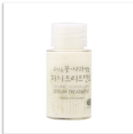
Sérum na akné WHAMISA (20 ml, 220 Kč) aktivně dezinfikuje, otevírá a čistí zanesené póry a tím redukuje vznik černých teček.