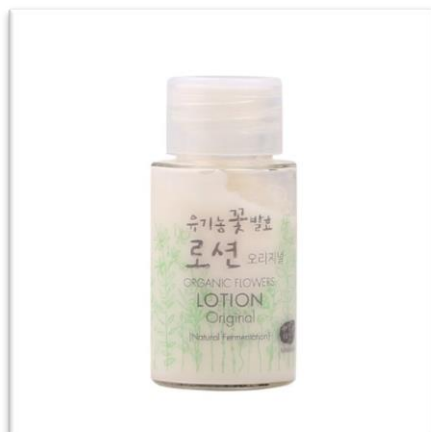
Lotion Original WHAMISA (20 ml, 220 Kč) může nahradit denní a noční krém, vhodný pro mastnou pleť.