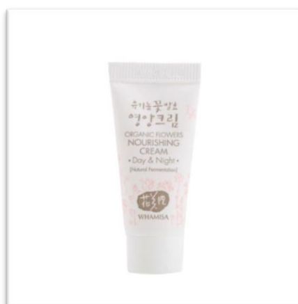
Výživný krém WHAMISA (5 g, 170 Kč) se snadno vstřebá. Pomáhá dosáhnout mladistvé a pružné pleti.