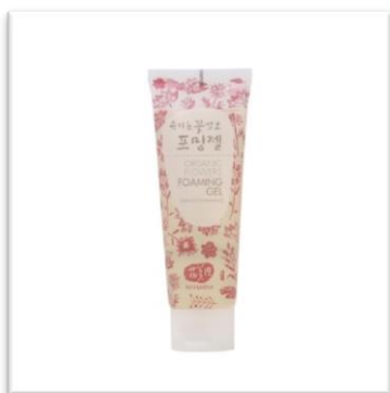
Pěnový čistící gel WHAMISA (20 ml, 180 Kč) Odstraňuje nečistoty a uvolňuje póry.