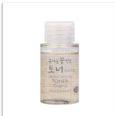
Tonikum Original WHAMISA (20 ml, 220 Kč) má vlastnosti séra a je vhodné pro mastnou a smíšenou pleť.