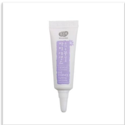
Oční krém WHAMISA (3 ml, 200 Kč) rozjasňuje a omlazuje očního okolí. Pomáhá odstranit vrásky, váčky a kruhy pod očima.