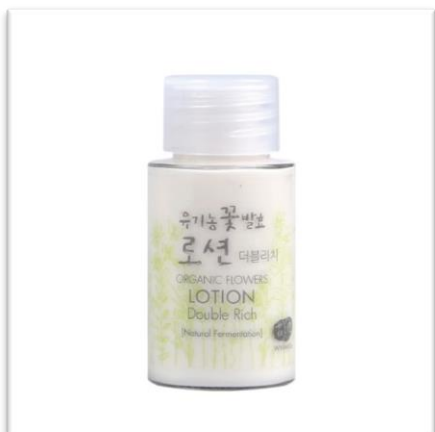
Lotion Double Rich WHAMISA (20 ml, 220 Kč) může nahradit denní a noční krém, vhodný pro suchou a normální pleť.