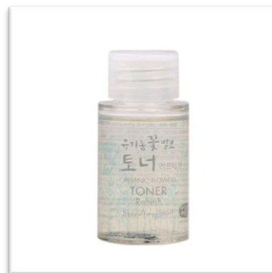
Tonikum Refresh WHAMISA (20 ml, 220 Kč) má vlastnosti séra a je vhodné pro aknézní a mastnou pleť.