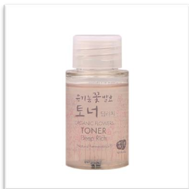
Tonikum Deep Rich WHAMISA (20 ml, 220 Kč) má vlastnosti séra a je vhodné pro suchou a normální pleť.